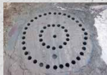
頭部付近のコアの採取